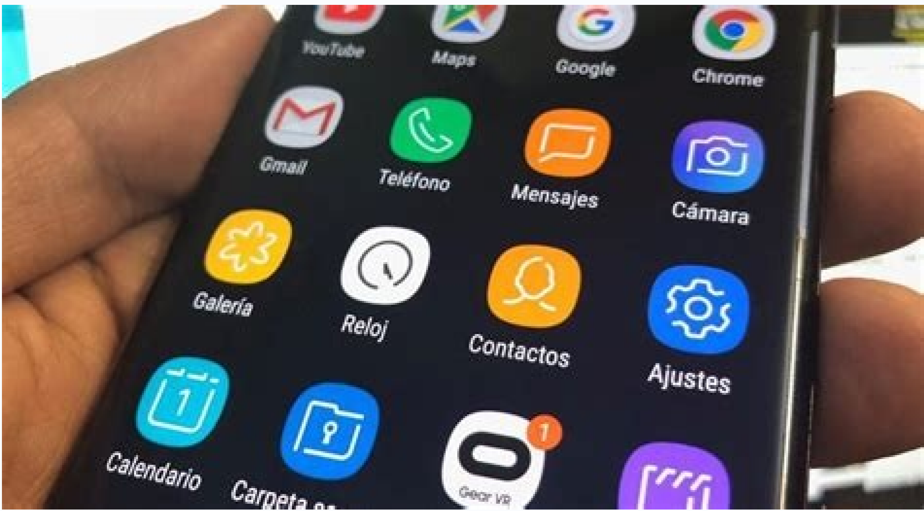
Jak zwiększyć pamięć ram w telefonie z androidem.